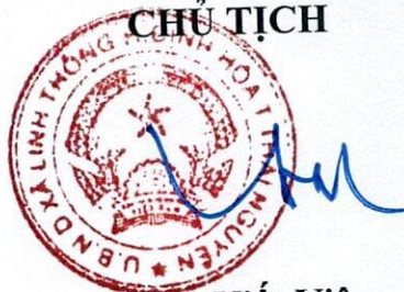
Lưu Viết Viên